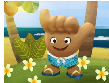
ハワイ州観光局キャラクター Shaka ちゃん

Shaka はハワイでは、挨拶によく使われる、グーにした手から親指と小指のみを立てて手のひらを見せるサインですが、この Shaka ちゃんは、もともとグーであったのが、ハワイ訪問以来、優しさ(Akahai)、協調性(Lōkahi)、思いやり(Olu'olu)、謙虚さ(Ha'aha'a)、忍耐(Ahonui)（詳細は次頁をご参照ください）といったアロハスピリットを学んだことによって、Shaka に変わり、今までの仕事と自宅だけの生活から幸せな時間を過ごすことができるようになり、心が満ち溢れるようになりました。そして、この想いをより多くの皆様と共有、共感していきます。