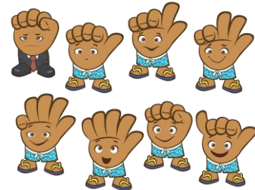
Mr.グーから Shaka ちゃんへ変わる様子

Shaka ちゃんの物語は、ハワイでは、親から子へと代々言い伝えられる、子どもへのしつけとして、日本のおとぎ話のように子どもに読み聞かせされている物語の一つです。HTJ では、Shaka ちゃんを起用することによって、今後、日本でも親から子に、Shaka ちゃんの物語を読み聞かせ、アロハの心を持つ優しく、思いやりがあり、協調性や忍耐力、そして謙虚さを兼ね備えた子どもに育てて頂けることを願っています。